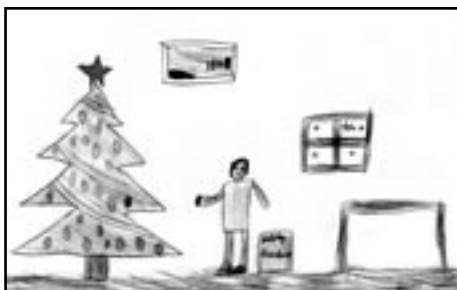
rys. Wojciech Kowalski

Okres Bożego Narodzenia obfitował w rozmaite konkursy o świątecznej tematyce. Nasi uczniowie chętnie brali w nich udział; zresztą jak każdego roku.