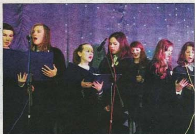
W ramach projektu uczniowie śpiewają w chórze

Napisano o nas w Dzienniku Polskim, w środę 20 marca 2013 r, w dodatku „Powiat Krakowski”. Poniżej prezentujemy skan całego artykułu.