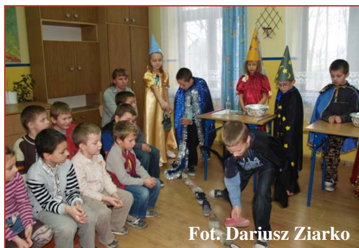
Fot. Dariusz Ziarko