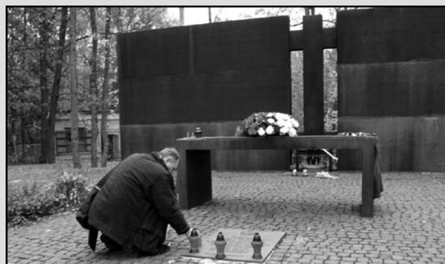
Cmentarz Ofiar Totalitaryzmu w Charkowie